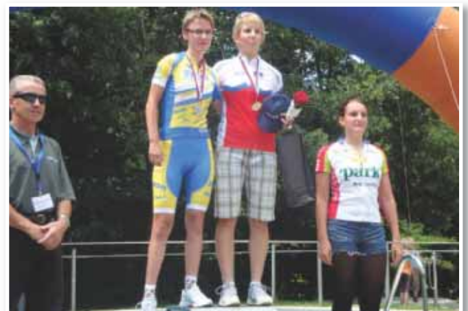
... in kolesarke pogosto stopili na oder za zmagovalce