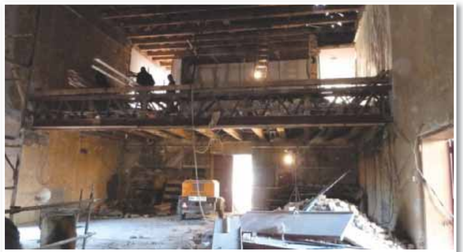
Od starega kulturnega doma je ostala le lupina

»Leto 2011 smo pričeli kljub vsem težavam optimistično in z velikimi načrti. V proračunu smo si zastavili nove projekte, kar nekaj pa jih je bilo že v izvajanju, kot na primer Celovita oskrba SV Slovenije s pitno vodo in rekonstrukcija kulturnega doma v Lenartu. Pri obeh navedenih projektih nismo imeli sreče z izvajalci, saj smo morali med gradnjo izbrati nove izvajalce zaradi stečajev prvotno izbranih izvajalcev. Vse to je povzročilo zamude pri izvajanju oziroma pripravo novih terminskih planov, ki so roke izvedb premaknili v naslednje leto.