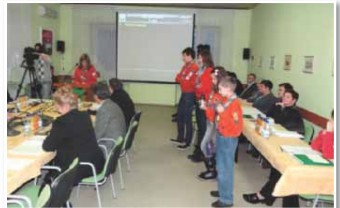
Skavti so na sejo občinskega sveta prinesli luč miru