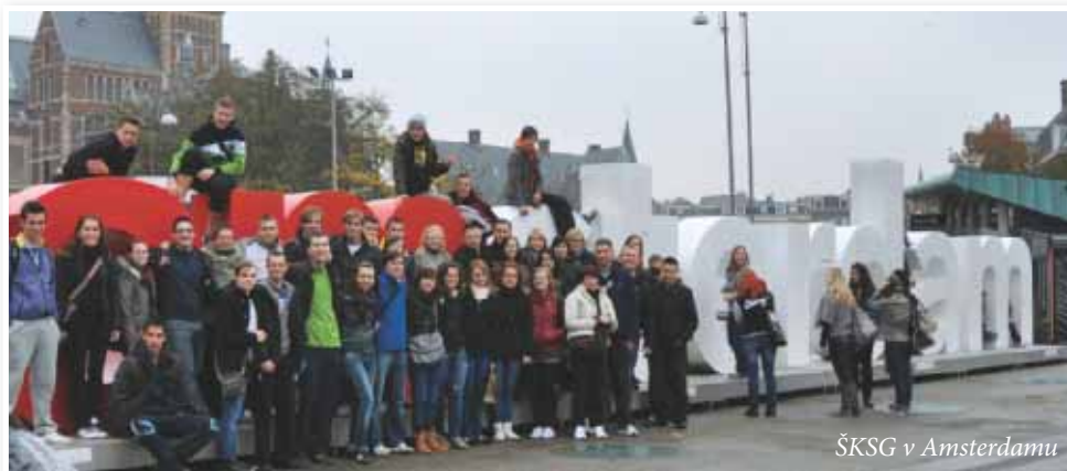
ŠKSG v Amsterdamu