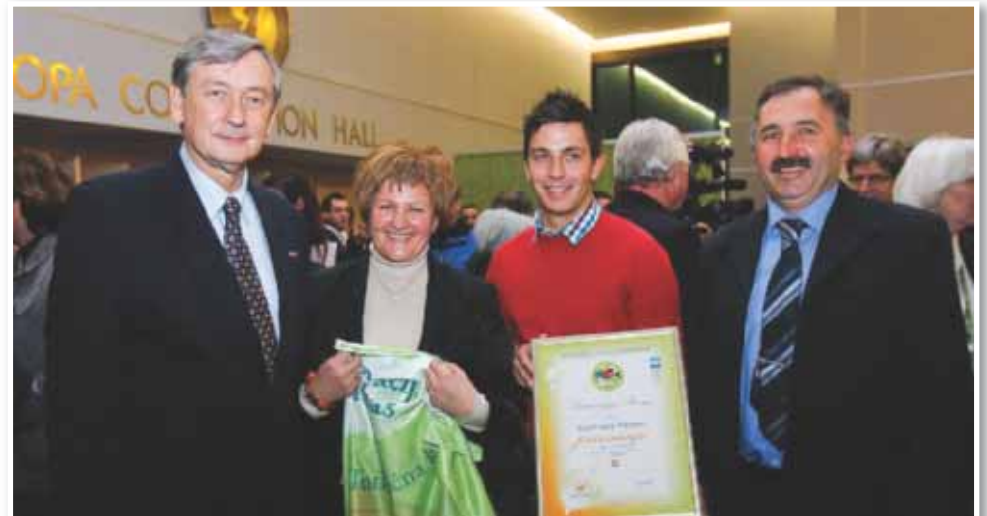
Predsednik republike s člani nagrajene družine