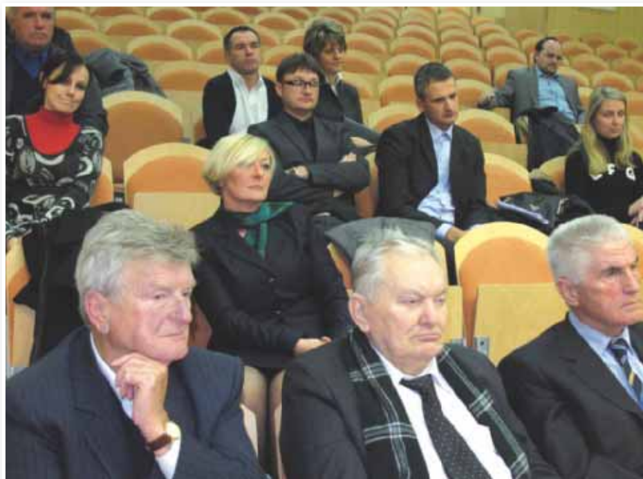
Na sestanku ustanove dr. Antona Trstenjaka so sodelovali mnogi ugledni strokovnjaki in župani

Nato je ustanova podelila štipendije za doktorski in magistrski študij, poleg tega bo Trstenjakova ustanova podprla nekaj projektov, ki