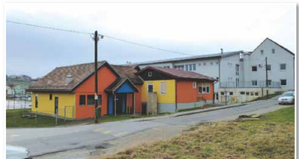
V Benediktu bo zgrajen 8-oddelčni vrtec

Gumzar vidi največjo pridobitev za kraj in občino v tem, da je investitor – to je podjetje CMC Celje – pridobil gradbeno dovoljenje za