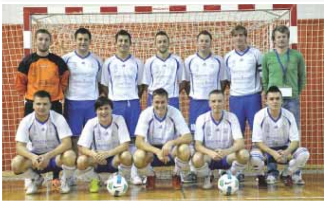
Članska ekipa Gostišče pri Antonu