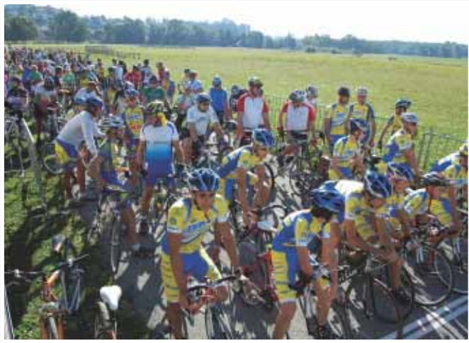
Kolesarskega maratona po občini Lenart se je udeležilo veliko kolesarjev

na dejstvo, da jim je ponovno uspelo obuditi nekatere kolesarske prireditve iz preteklosti. Z njimi želijo vzpodbuditi čim več mladih, da sedijo na kolo in na ta način kvalitetno preživijo svoj prosti čas. Meseca maja so organizirali šolsko prvenstvo osnovnih šol občine Lenart ter sosednjih občin. Tekmovanje je potekalo na ŠRC Polena. Tekmovanje pa je služilo tudi temu, da se otrokom osnovnih šol predstavi cestno kolesarstvo. Novost v tem letu pa je šola kolesarjenja z Mr. BO-jem (zaščitni znak TBP