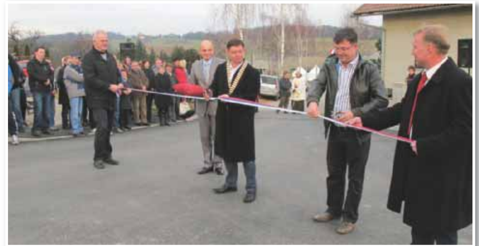
Na slovesnosti ob odprtju prenovljene ulice so se zbrali številni domačini