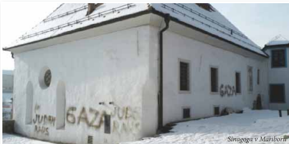
Sinagoga v Mariboru

Mednarodni dan boja proti fašizmu in antisemitizmu, ki je po vsem svetu 9. novembra priložnost za opozarjanje na rasizem in desničarski ekstremizem, je povezan s spominom na »kristalno noč« leta 1938 v Nemčiji, ko so nacisti v noči iz 9. na 10. november izvedli množični pogrom nad Judi, na veliko uničevali judovske trgovine in požigali sinagoge. To je bila napoved, da bodo nacisti brez milosti uredili judovsko vprašanje v Nemčiji in v drugih delih stare celine, po katerih so se v okviru priprav na vojaški spopad resno ozirali že od leta 1933 dalje. Po začetku druge svetovne vojne se je začel uničevalni genocid nad Judi, Romi, Slovani, ... Zgodil se je holokavst, v katerem je bila uničena tudi večina od okoli 820 predvojnih slovenskih Judov. Največji davek so plačali Judje v Prekmurju.