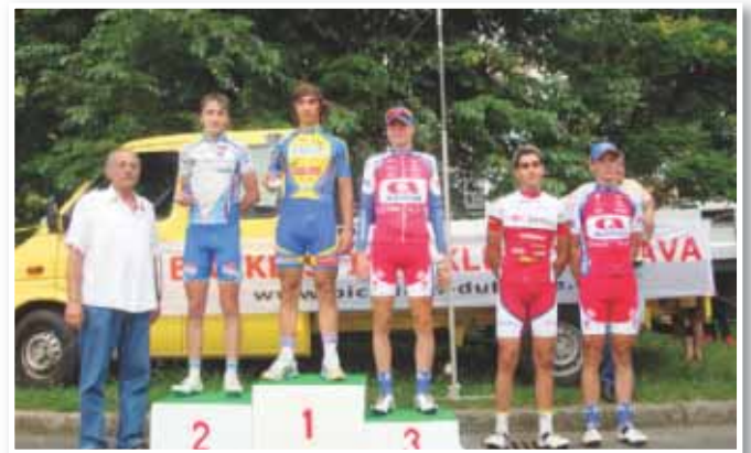
Tudi v letu 2011 so lenarški kolesarji ...

Poleg uspešnega tekmovalnega dela sezone pa so pri KK TBP Lenart še posebej ponosni