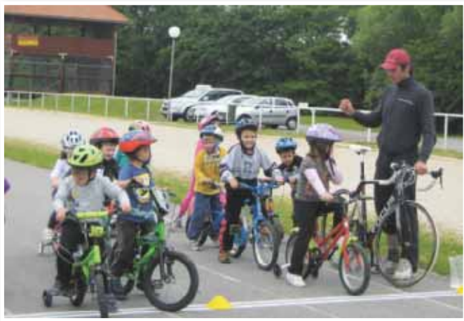
Novost v letu 2011 je tudi šola kolesarjenja z Mr. bo-jem

na dejstvo, da jim je ponovno uspelo obuditi nekatere kolesarske prireditve iz preteklosti. Z njimi želijo vzpodbuditi čim več mladih, da sedijo na kolo in na ta način kvalitetno preživijo svoj prosti čas. Meseca maja so organizirali šolsko prvenstvo osnovnih šol občine Lenart ter sosednjih občin. Tekmovanje je potekalo na ŠRC Polena. Tekmovanje pa je služilo tudi temu, da se otrokom osnovnih šol predstavi cestno kolesarstvo. Novost v tem letu pa je šola kolesarjenja z Mr. BO-jem (zaščitni znak TBP