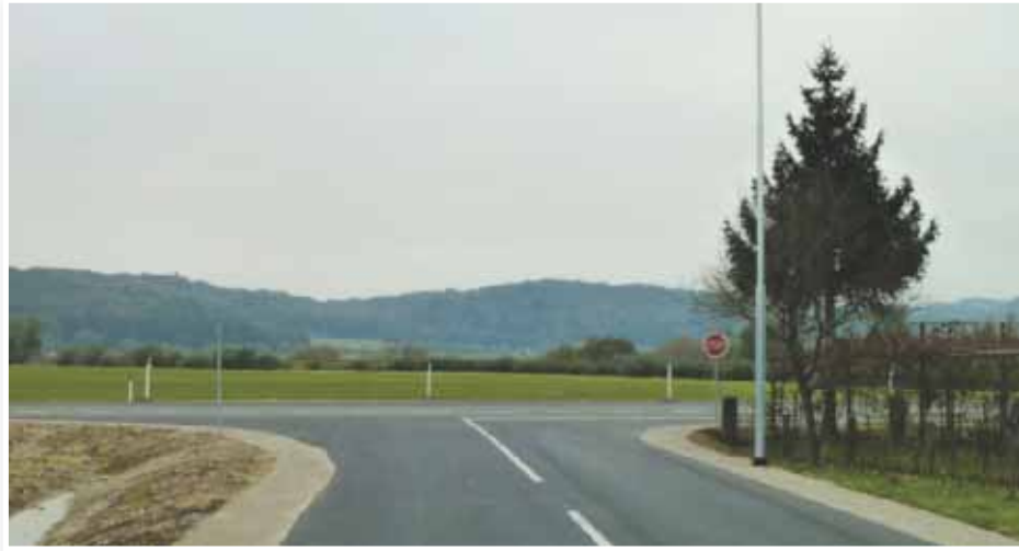
Namesto krožišča le priključek na vzhodno obvoznico

V občini seveda nismo pozabili na kulturna in družabna dogajanja, ki bogatijo naš vsakdan. Tako smo organizirali že tradicionalne poletne prireditve, ki jih poznamo pod imenom LenArt in vse poletje skrbijo za vse generacije naših občanov in drugih obiskovalcev. Veseli me, da so prireditve dobro obiskane in da so jih ljudje vzeli za svoje. Počasi se uveljavljata tudi božično novoletni in velikonočni sejem, ki jih je pod svoje okrilje prevzel TIC, v letošnjem letu pa sem bil izredno vesel tudi dobro obiskanega kmetijsko-obrtnega sejma na Poleni, katerega soorganizator je bila občina Lenart.«