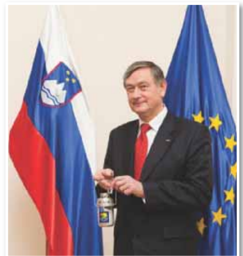
Slovenski skavti in taborniki so Luč miru izročili tudi predsedniku republike dr. Danilu Türku

Da Luč Miru iz Betlehema povezuje, dokazujemo tudi organizatorji. Nosilec akcije je Združenje slovenskih katoliških skavtinj in skavtov (ZSKSS), sodelujejo pa še Zveza tabornikov Slovenije (ZTS-NSO), Zveza bratovščin odraslih katoliških skavtinj in skavtov (ZBOKSS) ter člani Slovenske zamejske skavtske organizacije (SZSO).