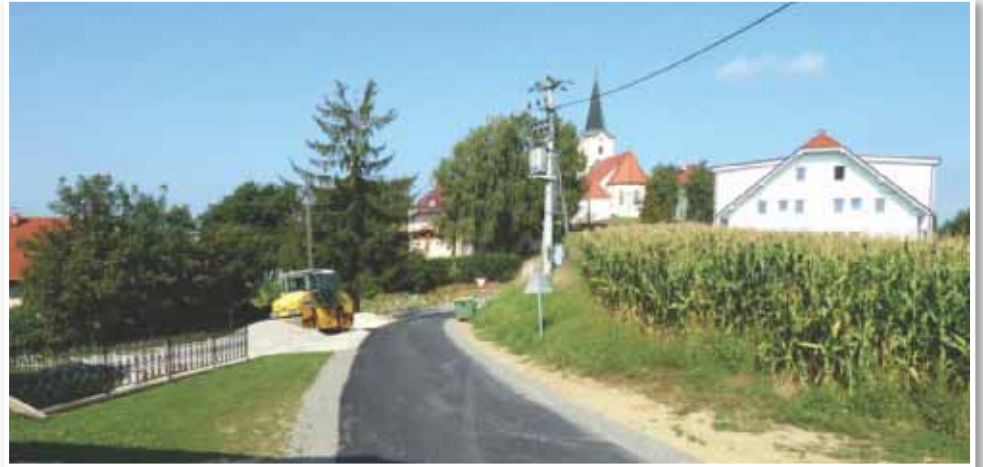
Po izgradnji kanalizacije so cestišča na novo asfaltirali

Na občini so se letos lotili tudi spremembe Občinskega prostorskega načrta (OPN), saj so zaznali precejšnje pomanjkanje zazidalnih površin za individualno stanovanjsko izgradnjo. Da so imeli prav, potrjuje preko 130 pobud za spremembo zemljišč iz kmetijskega v stavbno.