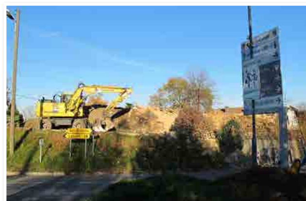
S sodobno mehanizacijo so veliko zgradbo nekdanje Altove gostilne po kratkem postopku spremenili v velik kup opeke.