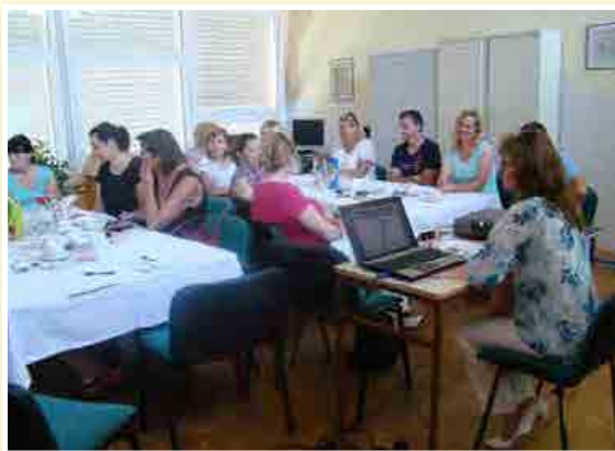
Srečanje z organizatorji prehrane v vrtcih v Mariboru

letu je aktivno k pripravi projektnega predloga »Samooskrba regije« pristopilo Območno razvojno partnerstvo Slovenske gorice – ORP SG (občine Benedikt, Cerkevjak, Duplek, Lenart, Pesnica, Sveta Ana, Sv. Trojica v Slov.