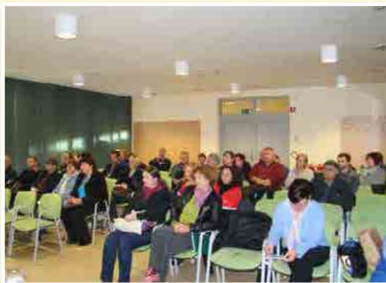
Srečanje s pridelovalci 4. novembra v Lenartu

sežejo znesek, ki ga imajo za hrano na voljo. Želimo si, da pri tem procesu aktivno sodelujejo tudi starši otrok in mladostnikov, saj bomo le z njihovo pomočjo in podporo lahko aktivnosti dosledno izpeljali. Prehra-