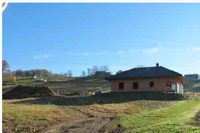
V novi soseski B-15 v Benediktu rastejo nove hiše kot gobe po dežju.

financiralo podjetje Juven, d. o. o., ki sedaj prodaja opremljene parcele ali hiše, kupcem zemljišč pa zgradi hišo tudi po naročilu.