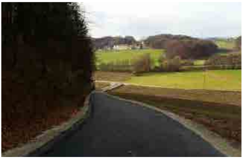
Preplaščeni faroški klanec

prometne infrastrukture in komunikacij. Za to postavko je namreč namenjenih 603.000 €. Od tega cca 150.000 € odpade na redno vzdrževanje občinskih cest in javnih poti (vzdrževanje dotrajanih cestnih odsekov in gramoziranje makadamskih cestišč). Za zagotovitev zimske službe je predvidenih 50.000 €, 15.000 € pa za poletno košnjo trave. Med največjimi