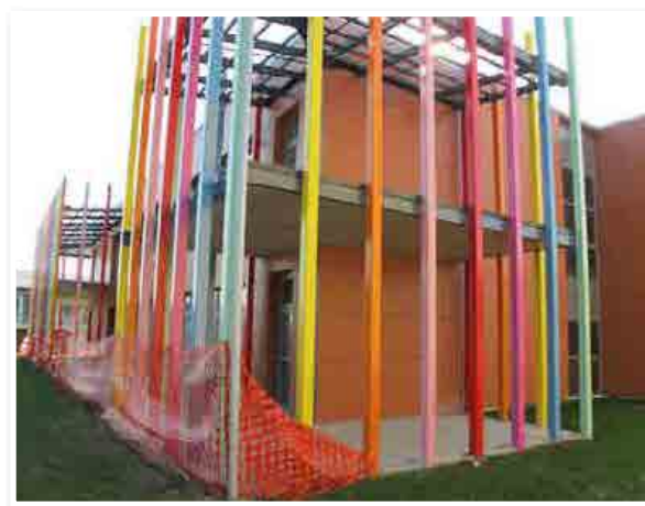
Investicijo v novi vrtec bodo v Benediktu nadaljevali v letu 2016. Za to so zaslužni vsi člani občinskega sveta, saj so na izredni seji odločitev sprejeli soglasno.