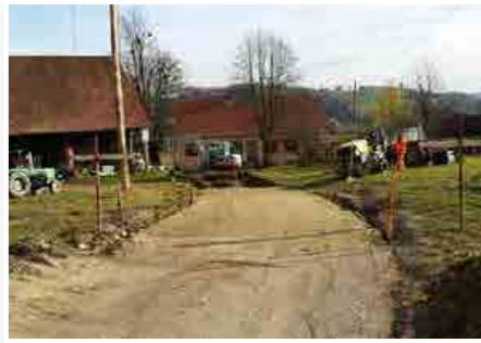
Velik del proračuna bo v prihodnjem letu namenjen investicijam v cestno infrastrukturo.