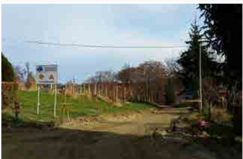
Zemeljska dela na odsekih Repa in Zaletinger v Sr. Gasteraju bodo končana letos, asfaltiranje sledi prihodnje leto.

občinskimi investicijami v prihodnjem letu bo dokončanje in asfaltiranje cestnih odsekov Zaletinger in Repa. Občina pa bo tudi v prihodnjem letu sofinancirala asfaltiranje nekategoriziranih cestnih odsekov. V občinskem proračunu za leto 2016 je zajeta tudi preplastitev ceste čez Sr. Gasteraj v dolžini 2,5 km. Ker v zadnjih letih precej težav povzročajo plazovi, je občina to leto namenila 15.000 € za sanacijo le-teh.