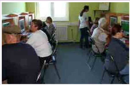
Začetno učenje računalništva