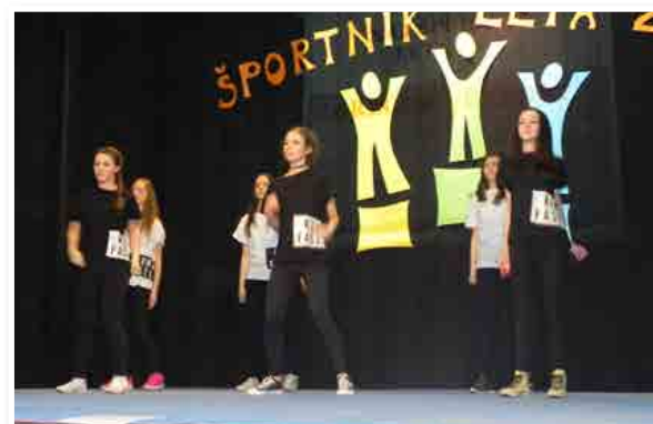
Starejša plesna skupina O.Š J. Hudalesa