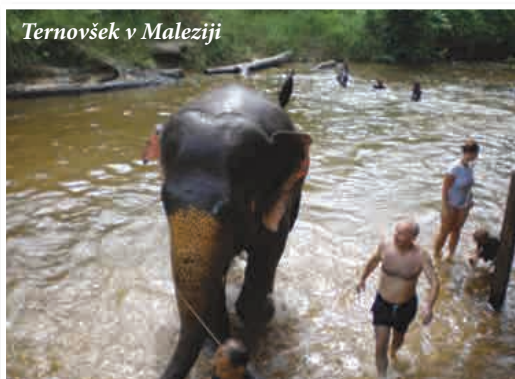
Ternovšek v Maleziji