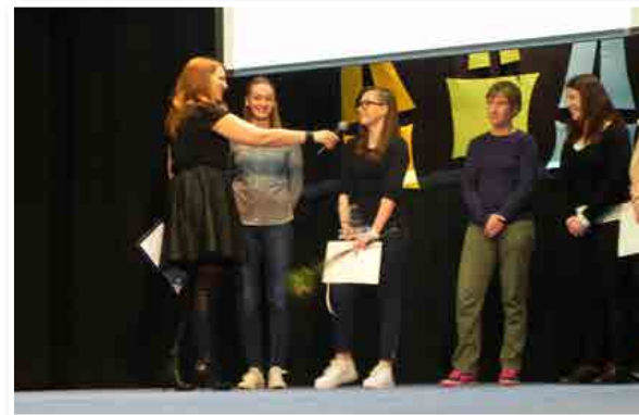
Najuspešnejša ženska ekipa KMN Slovenske gorice