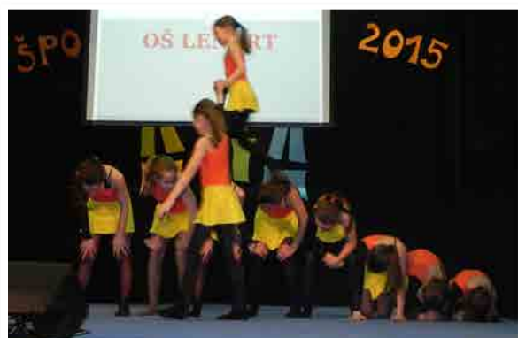
Mlajša plesna skupina O.Š J. Hudalesa