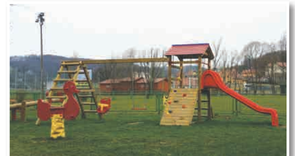
Nova otroška igrala

V sodelovanju s športnim društvom Sv. Jurij je občina že v preteklem letu uredila okoliščino športnega parka z namestitvijo novih otroških igral.