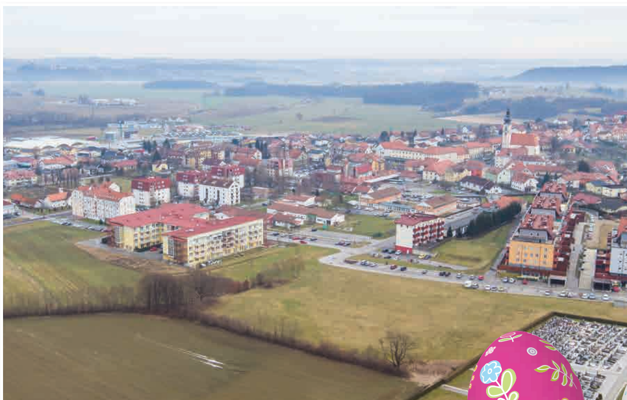
Mesto Lenart v pričakovanju pomladi, foto: Toni Konrad